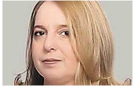
* Haga click en la foto para abrir la galería

Para nosotros el nuevo modelo de medios en la Argentina debe contener a los más chicos, asegurarles condiciones de competitividad y garantías de permanencia. Si el borrador oficial se convierte en ley, especialmente por sus artículos 25, 38, 40 y 143, las reglas del juego cambiarán y solo los grupos grandes tendrán capacidad de resistir la competencia de los nuevos actores monopólicos.